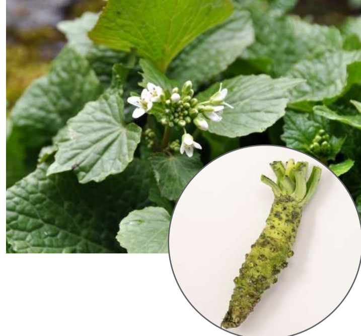
アブラナ科 ワサビ