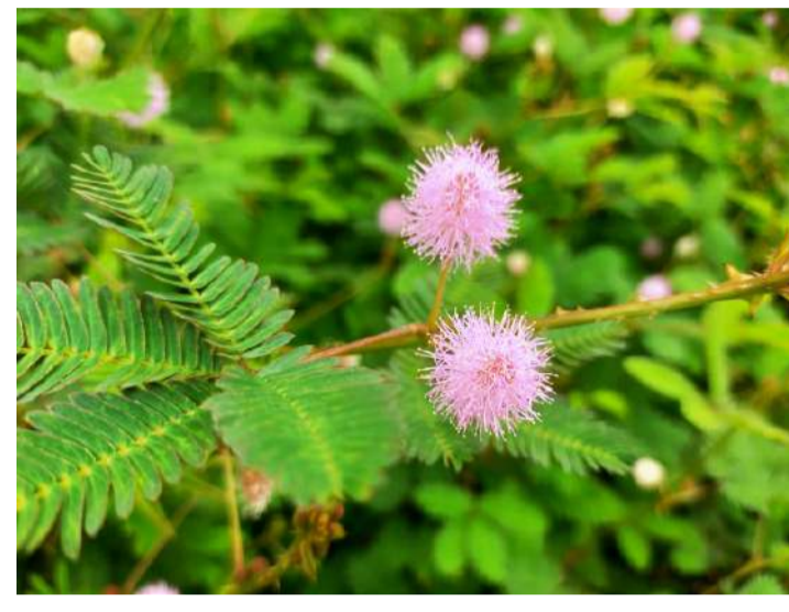
マメ科 オジギソウ