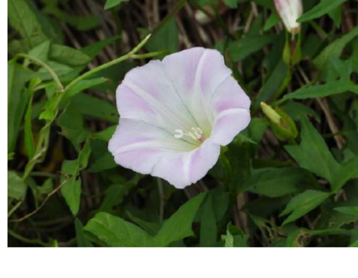
ヒルガオ科 コヒルガオ