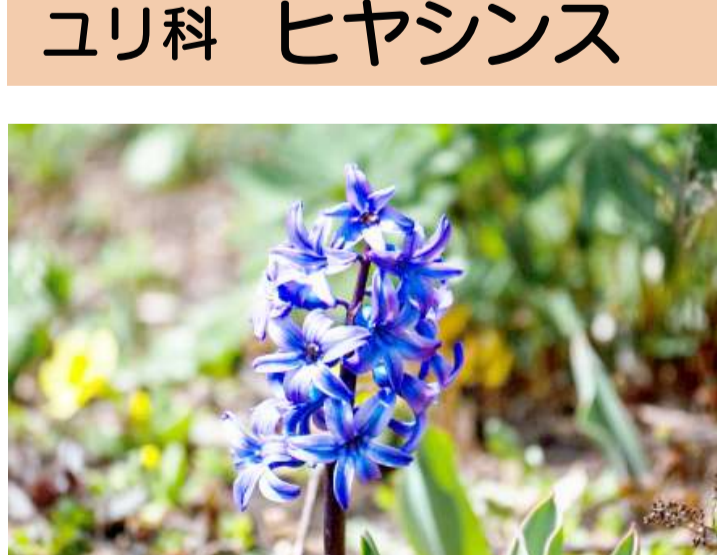
ユリ科 ヒヤシンス