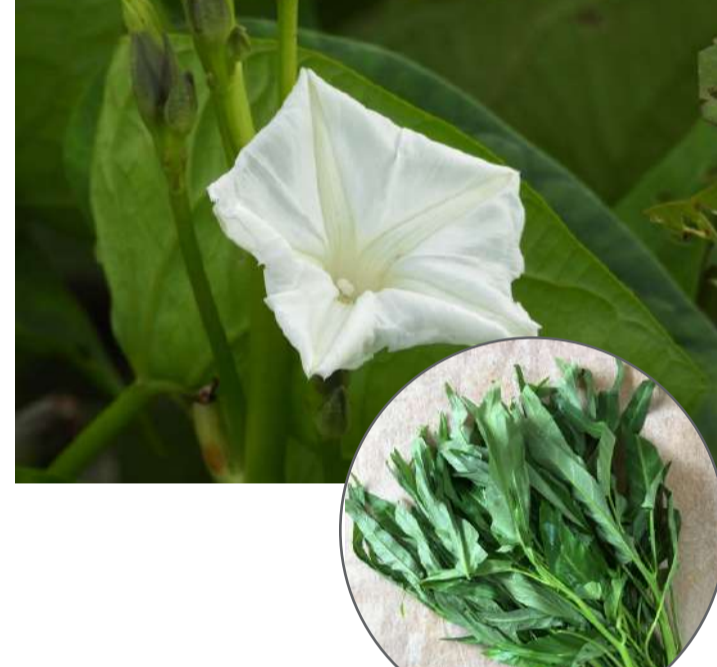
ヒルガオ科 クウシンサイ