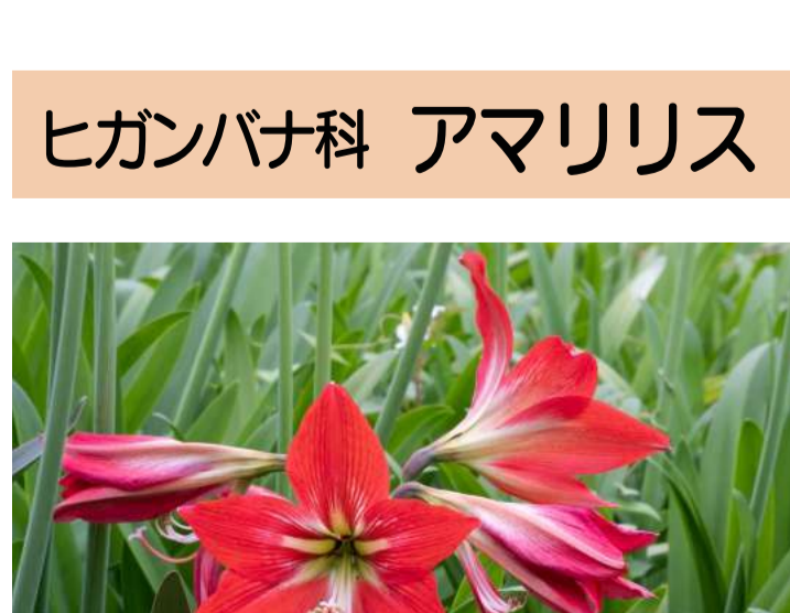
ヒガンバナ科 アマリリス