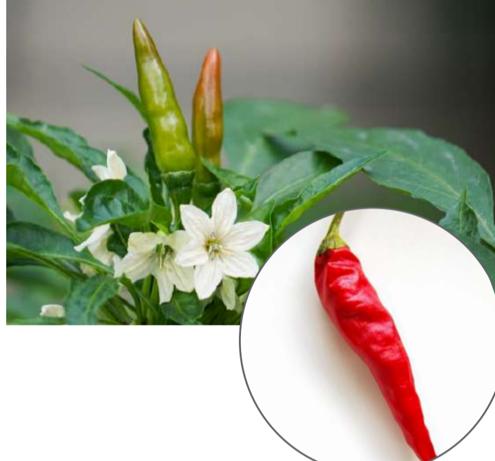
ナス科 トウガラシ