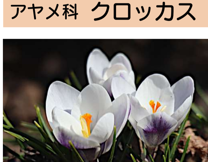
アヤメ科 クロッカス