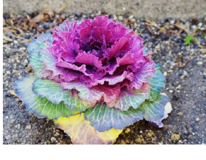
アブラナ科 ハボタン