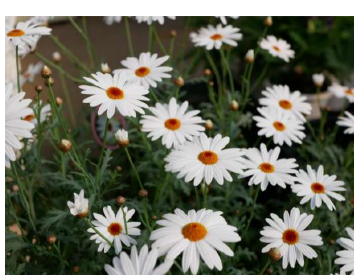
キク科 マーガレット