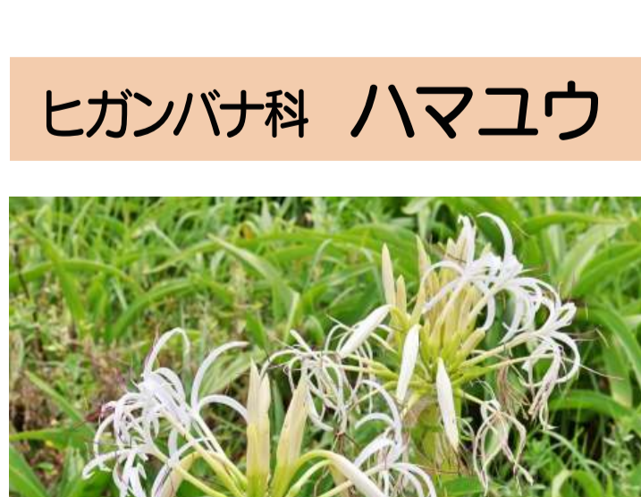
ヒガンバナ科 ハマユウ