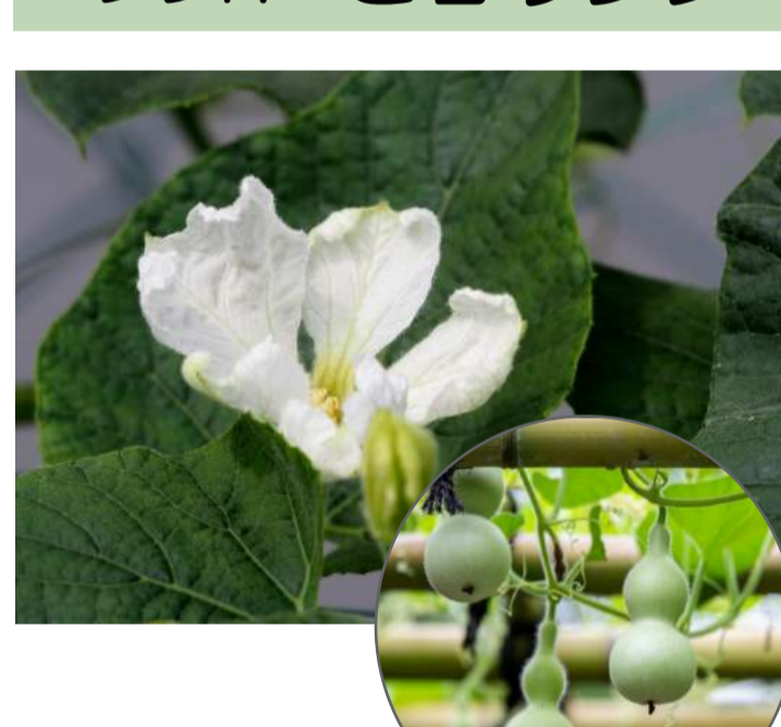
ウリ科 ヒョウタン