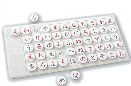
磁石あいうえお盤 (すうじ盤50)