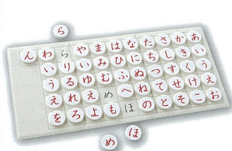
磁石あいうえお盤 (すうじ盤50)